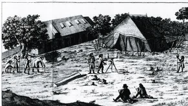
Nous trouvâmes que l'emplacement de la Tente dont à 34 Pieds au dessus du Niveau de la Rivière de Kille. 30 me 334 p. 28